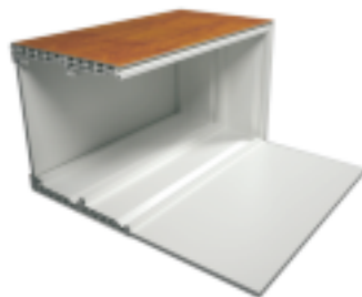
Cassonetto Restauro con celino