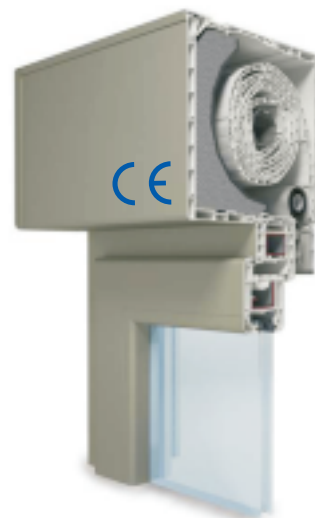
Sezione Cassonetto con Avvolgibile e Sezione Finestra